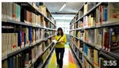
Virtuální prohlídka ÚK ČVUT (video)