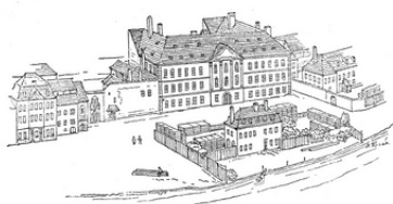
Byt F. A. L. Hergeta v domě na Kozím plácku na Starém Městě zvaném dům Broumovský (r. 1767)

V roce 1803 se Česká stavovská inženýrská škola transformovala z podnětu Františka Josefa Gerstnera na polytechnický ústav podle vzoru pařížské École Polytechnique a změnila svůj název na Královské české stavovské technické učiliště v Praze.