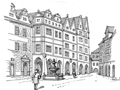
Byt J. F. Schora v domě U zlatého věnce na Malém rynku na Starém Městě (r. 1726)