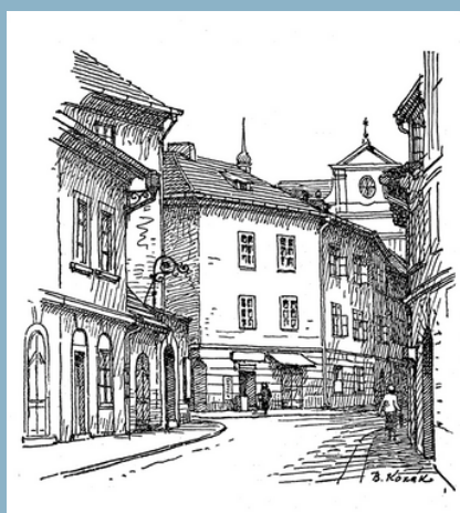
Byt Ch. J. Willenberga v domě na Starém Městě na rohu Aneské a Liliové ulice (r. 1720)